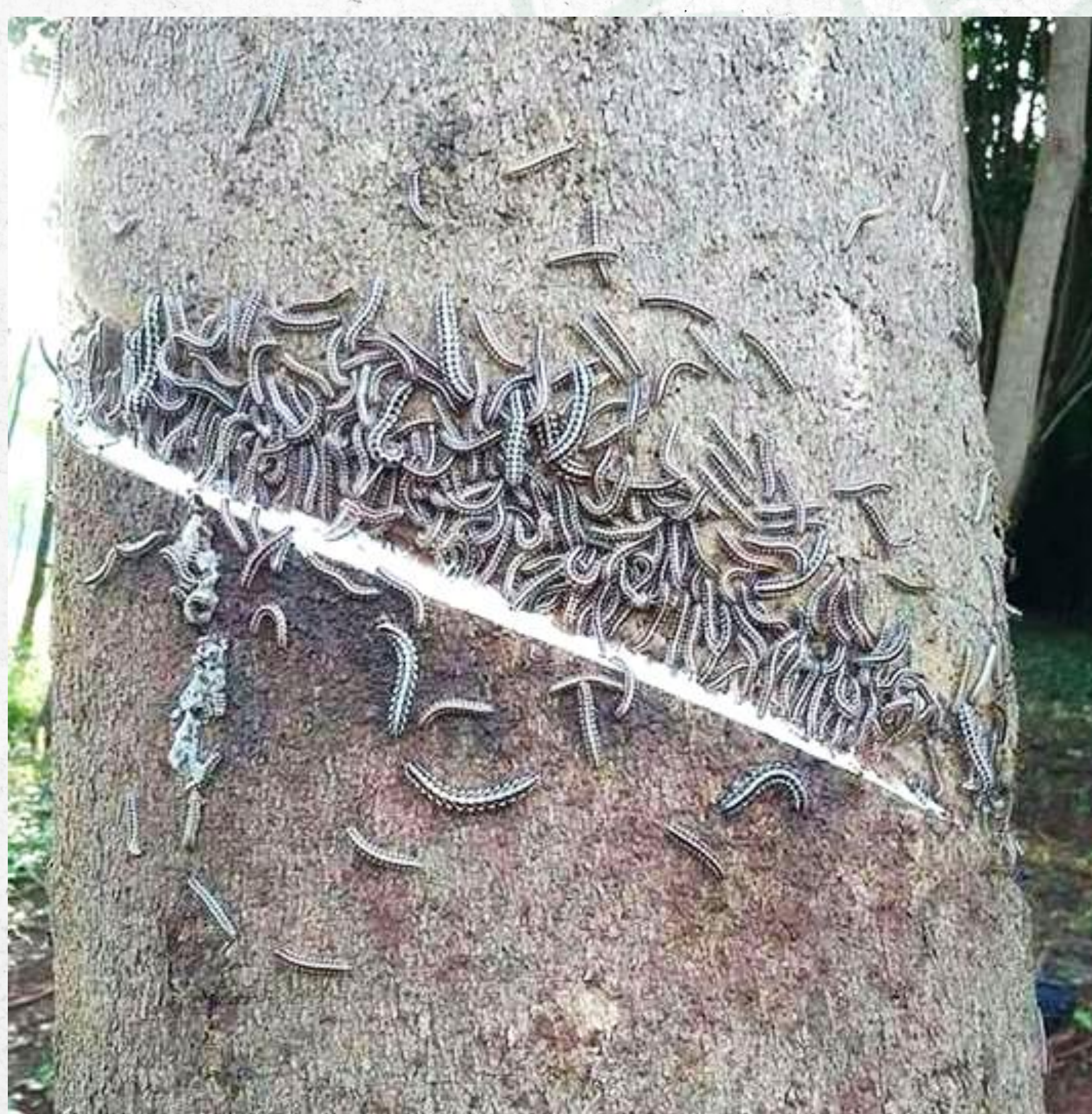
Figure 2 Swarming outbreak of Antheromorpha uncinata within a rubber plantation