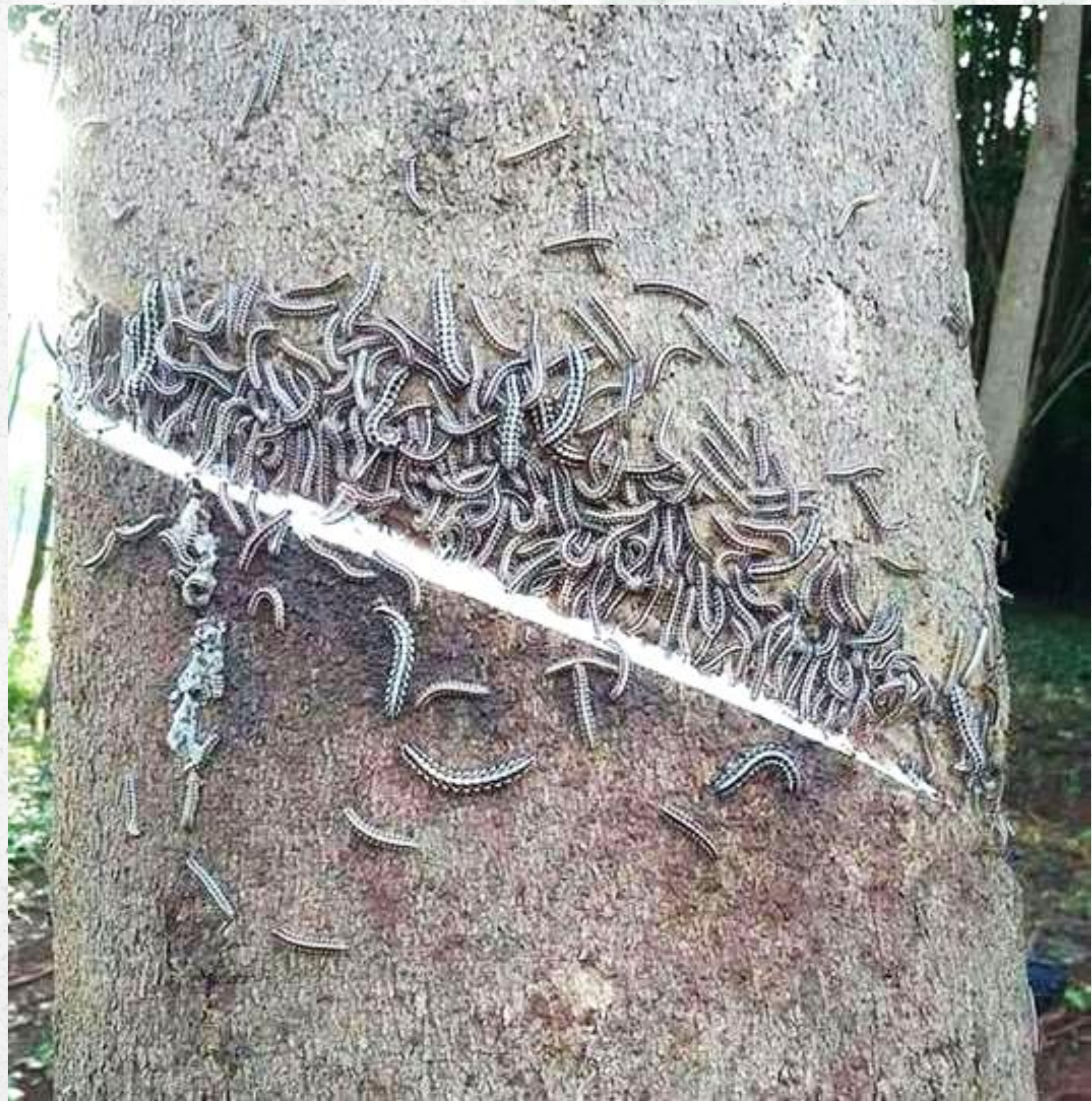
ภาพที่ 2 ภาพการระบาดของส่วนยางของกิ้งกือตะเข็บสามสี

เอกสารอ้างอิง ณัฐดนัย ลิขิตระการ, จักรพงษ์ สุภาวรรณ, วงศ์พันธ์ พรหมวงศ์, ฉัตรสุดา เผือกใจแก้ว, ธีรภรณ์ คำปลิว, พิสิษฐ์ พูลประเสริฐ, ปิยะวรรณ สุทธิประพันธ์ และ วรุตม์ ศิริวงศ์. (2562). ประสิทธิภาพของคาร์บาริล ฟิโปรนิล และไซเพอร์เมทริน ต่อกิ้งกือตะเข็บสามสี Antheromorpha uncinata . วารสารเกษตร , 35(2), 283-294. Attems, C. (1931). Die Familie Leptodesmidae und andere Polydesmiden. Zoologica (Stuttgart) , 79: 1-150.